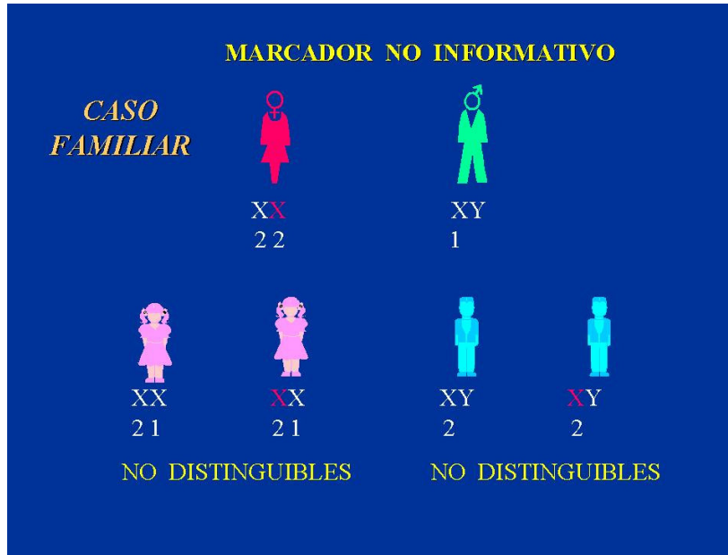
FIGURA 2. Limitante del diagnóstico molecular cuando un marcador no es informativo, se presenta la misma marca o señal (1,1 ó 2,2) en cada cromosoma X de la portadora obligada (en rojo).

Esto resulta de emplear marcadores de los genes que en ocasiones no presentan señales o marcas diferentes en cada uno de los cromosomas X de la portadora obligada y por lo tanto no resultan informativos (figura 2).