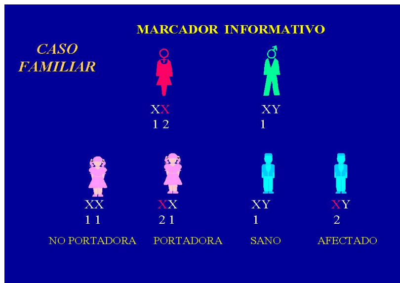
FIGURA 1. Diagnóstico molecular de portadoras de hemofilia con un marcador informativo (se observa una señal o marca diferente, 1 y 2 en cada cromosoma X). Las mujeres diagnosticadas como portadoras, al igual que la portadora obligada (en rojo), tienen un 50% de riesgo de heredar este rasgo a su descendencia.

Posteriormente, a partir de las portadoras obligadas y al menos un varón con hemofilia, se analiza al resto de los familiares para identificar a las mujeres en riesgo de haber recibido la información causante de la hemofilia. A partir de este estudio familiar, se les asigna como portadoras o no portadoras del gen afectado ( figura 1 ).