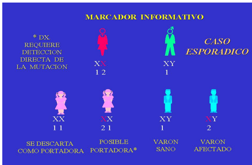
FIGURA 4. Diagnóstico de portadoras en casos esporádicos. Se requiere la secuenciación para descartar a las posibles portadoras.

Al igual que en los casos familiares, cuando las hijas no presentan el cromosoma materno con la marca asociada a la hemofilia, pueden descartarse como portadoras, aún sin saber si la madre es o no portadora ( figura 4 ). Cuando comparten la marca asociada a la hemofilia, tienen un gran riesgo de ser portadoras; sin embargo, podría descartarse por las probabilidades que existen de mosaicismo o mutación de novo (10%). Es importante tratar de determinar la mutación en el afectado y rastrear su origen. Primeramente, se buscará la mutación en la madre y hermanas una vez encontrada en el afectado. Si no la presentan las hermanas o la madre podrá tratarse de una mutación de novo o que la madre es mosaico para la misma. También para definir el riesgo de recurrencia en la madre, será de gran utilidad contar con las muestras de los abuelos para conocer en que cromosoma se origina la mutación y con esto determinar el riesgo a que sea heredado.